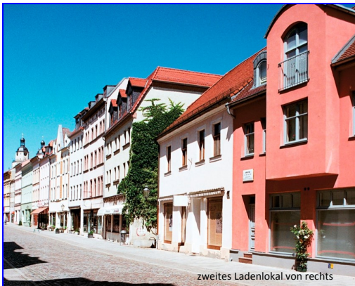
zweites Ladenlokal von rechts